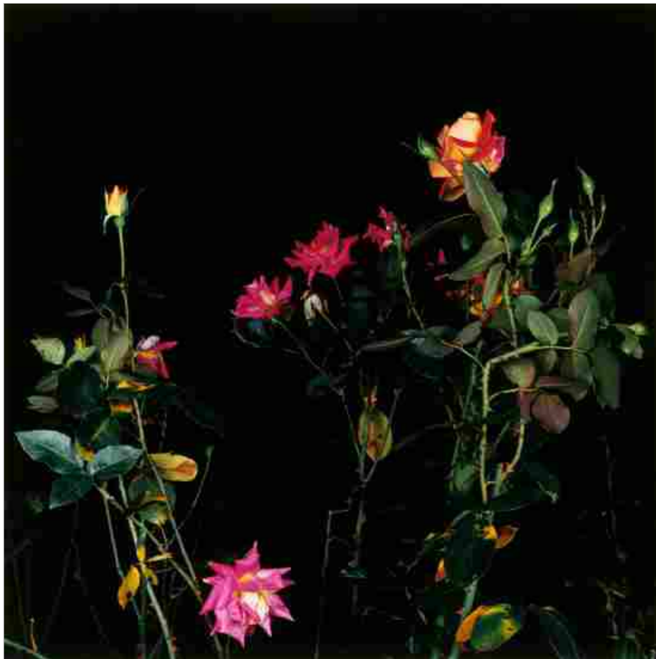
7 / 9 Sarah Jones, The Rose Gardens (Orange) (I), 2002. Stampa a colori montata su alluminio.