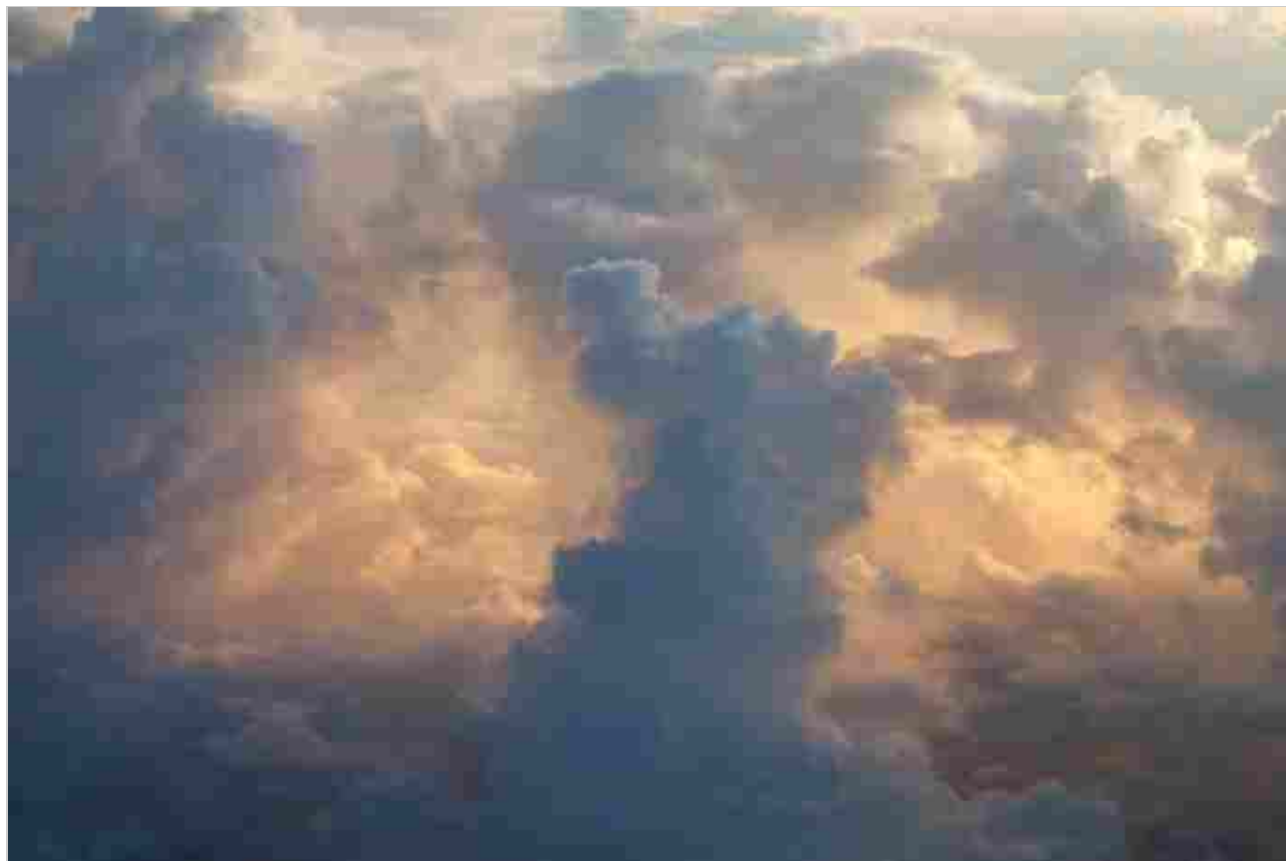
8 / 9 Wolfgang Tillmans, Lux , 2009. Stampa inkjet.