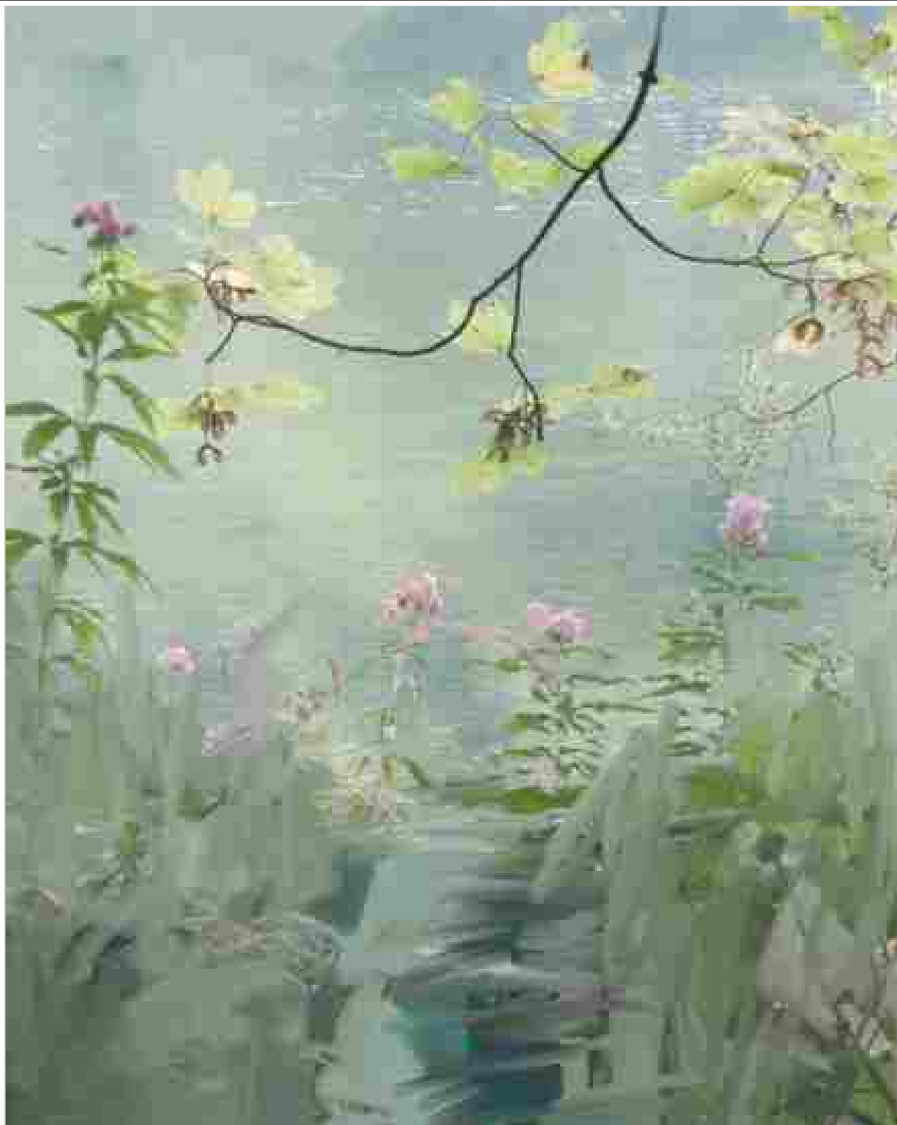
5 / 9 Sandra Kantanen, Untitled (Pink Flowers) , 2013. Stampa ai pigmenti su carta d'archivio.