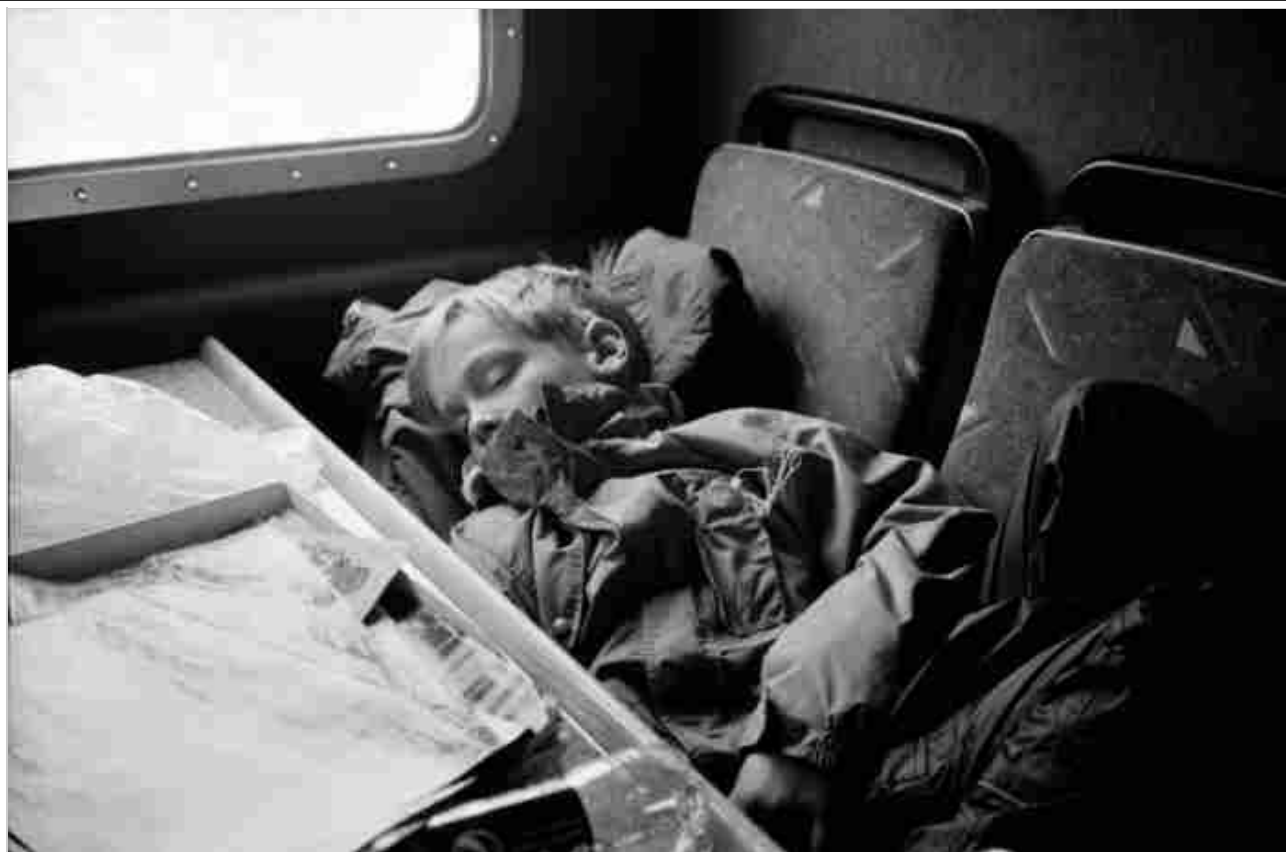
2 / 9 Hallgerður Hallgrímsdóttir, Untitled , 2012. Stampa a getto d'inchiostro.