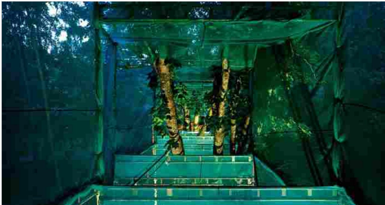
4 / 9 Ilkka Halso, Garden with a View, Inside view , 2010. Stampa a colori.