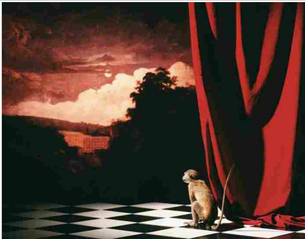
6 / 9 Olivier Richon, After Joseph of Derby, Arkwright Mills at Night , 1990. Stampa a colori.