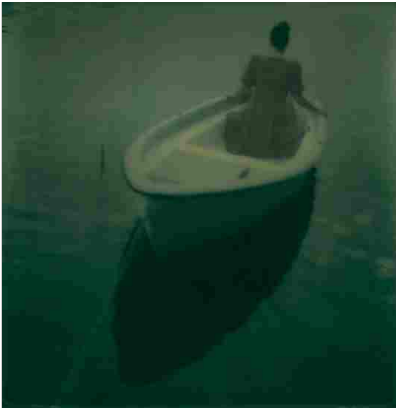
3 / 9 Astrid Kruse Jensen, Disappearing into the Past , nr. 55, 2012. Stampa su fibra d'archivio. © l'artista. Courtesy Collezione Fondazione Cassa di Risparmio di Modena.